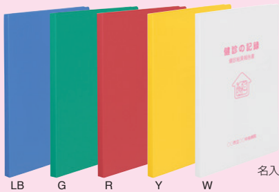
LB G R Y W 名入れイメージ