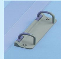
スリムサイズのプラスチックリングとじ具