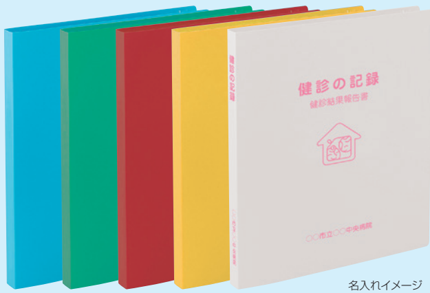
LB G R Y W 名入れイメージ