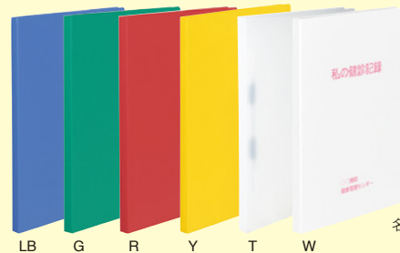
LB G R Y T W 名入れイメージ