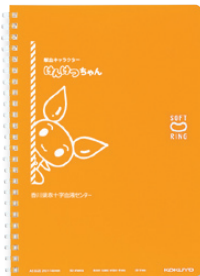
ソフトリングノート(ドット入り罫線) KO-SV331BT P.38-1

献血のお礼品や子供向けイベントのお土産品としてオリジナルキャラクターやメッセージなど印刷できる点を評価いただき、ご採用いただきました。