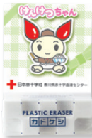
消しゴム〈カドケシ〉 KOケシ-U700-CD P.68-1