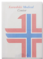
2ポケットホルダー (フルカラー対応) K140010 P.97-8

キャリングホルダーは採用活動時に資料を入れてお渡しした後もホルダーとして使えるところを評価いただきました。2ポケットホルダーは、入院される患者様にお渡しする重要書類と資料を分類できるということで、ご採用いただきました。