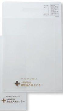
キャリングホルダー (2WAY) K140101 P.98-3