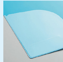
表紙ポケット(オプション)