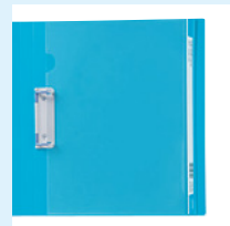
健診結果など、厚みのある書類もとじられる見出し付きホルダー(オプション)