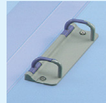
スリムサイズのプラスチックリングとじ具