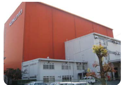
九州 IDC 外観

配送センターへご来社に際してご不明な点がございましたら、上記電話番号または、コクヨサプライロジスティクス本社 (06-6976-1370) まで、お気軽にお問い合わせ下さい。