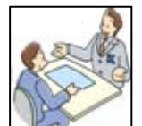
ルール構築 アドバイス